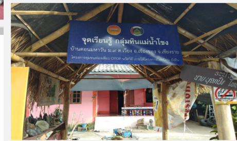
บ้านดอนมหาวัน หมู่ที่ 9 ตำบลเวียง