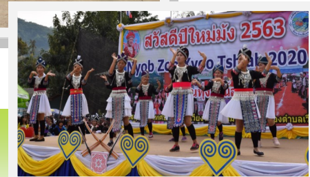
บ้านทุ่งพัฒนา หมู่ที่ 13 ตำบลเวียง